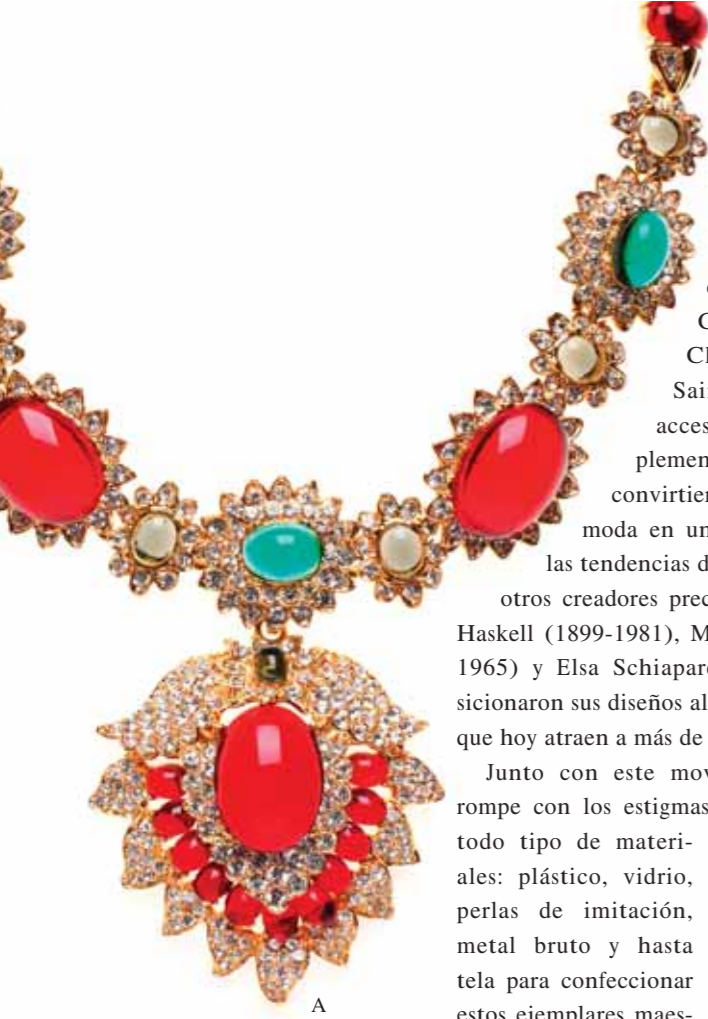
A. marca | Colección. Descripción del producto o pieza colocada en pág. telephoned umpteen.